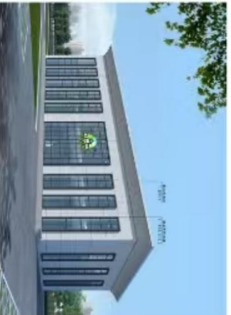
拟调整垃圾房及消防水泵间透视图效果图