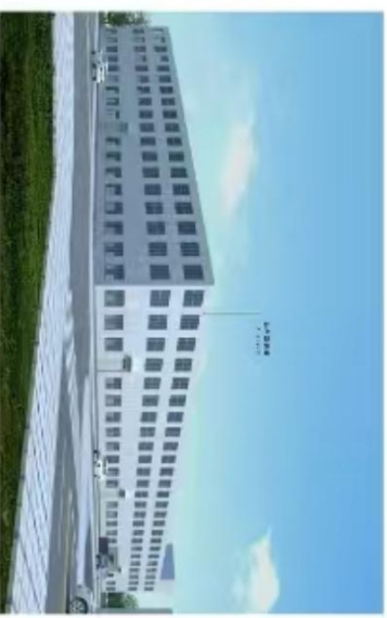
拟调整11#车间透视图效果图