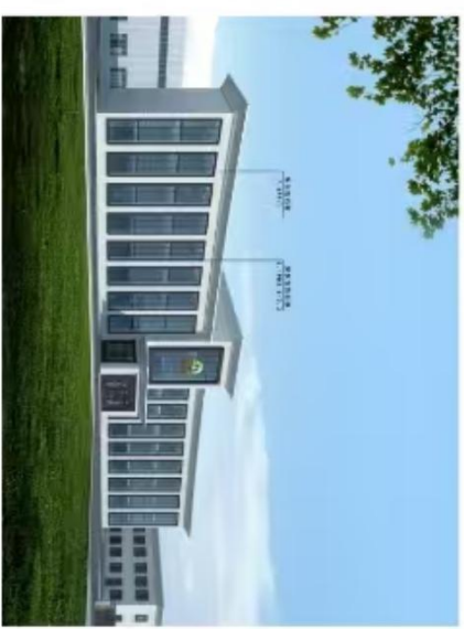
拟调整办公楼透视图效果图