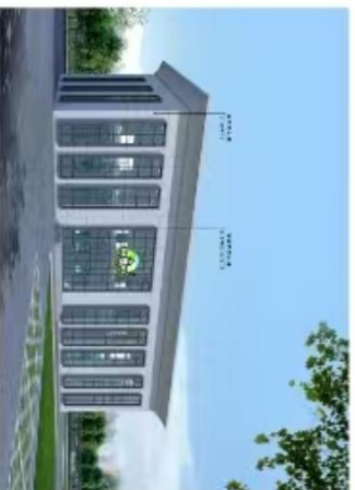
拟调整餐厅透视图效果图